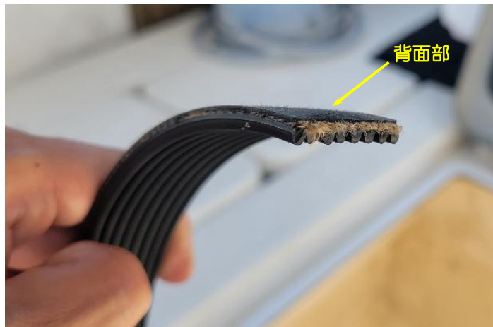
写真2 破断した本件ベルト

主機製造会社の代理店によれば、本件ベルトが破断したのは、破断した本件ベルトの背面部に硬化及び劣化した状態が見られ、また、使用時間や前回の交換時期を踏まえると、機関室内の熱やオイルミスト等の影響でゴムが硬化し、柔軟性を失ったことによるものと考えられるとのことであった。(写真2参照)