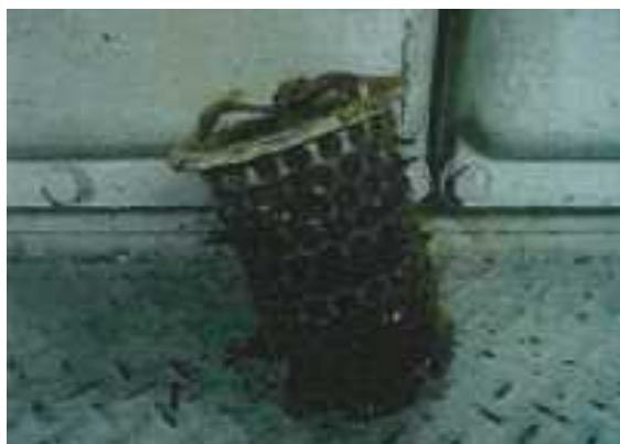
写真2 海水こし器内部のごみ