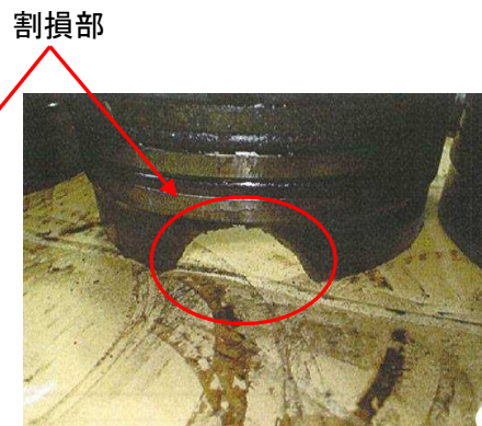
写真4 5番シリンダのシリンダライナ割損状況②