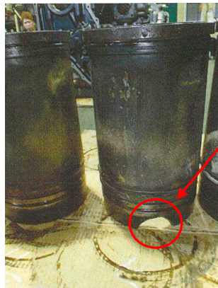
写真3 5番シリンダのシリンダライナ割損状況①