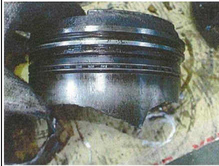
写真1 5番シリンダのピストン割損状況①

本船は、主機を陸揚げして点検した結果、5番シリンダのピストン及びシリンダライナの焼付き及び割損、全シリンダのピストン及びシリンダライナに縦傷、全シリンダのクランクピンメタル等に焼付き、5番シリンダのピストン冷却ノズルの曲損、潤滑油ポンプの破損等が認められた。(写真1～4参照)