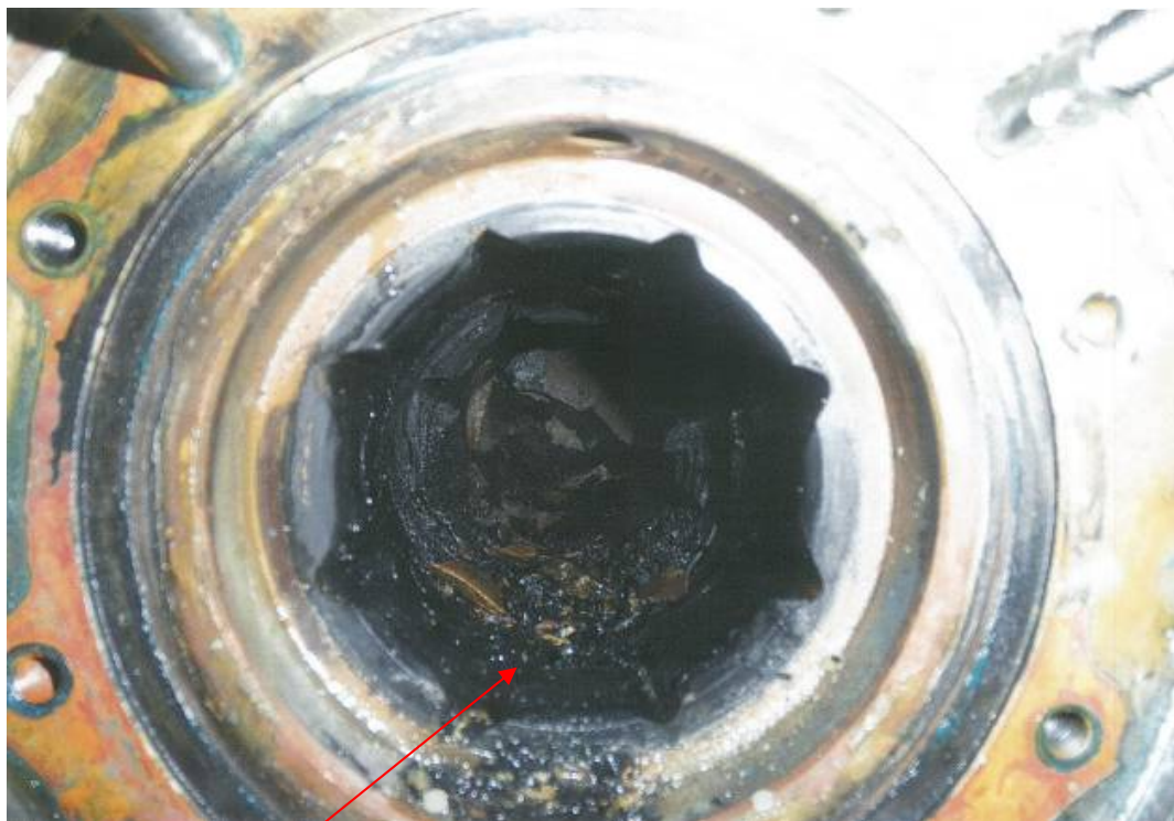
船尾管船首側軸受の支面材