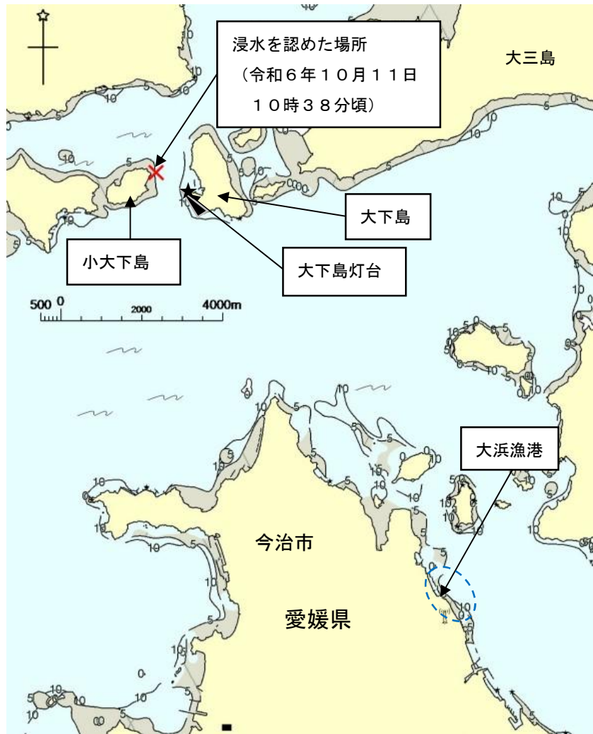
図1 事故発生場所概略図

本船は、後日、修理会社による点検の結果、主機のクラッチ潤滑油冷却器冷却海水出口側蓋の出口配管（以下「本件配管」という。）のゴム管との接続部が破断していたことが判明した。