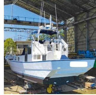
写真1 左舷船首