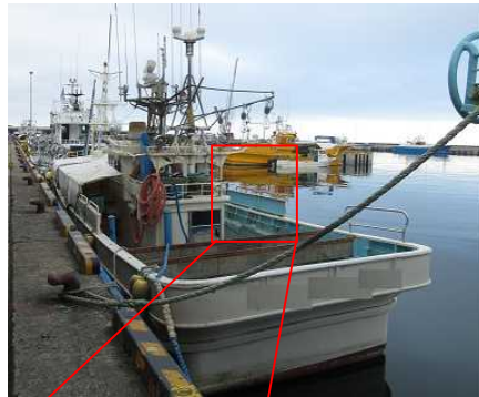
写真2 本船を船尾側から望む