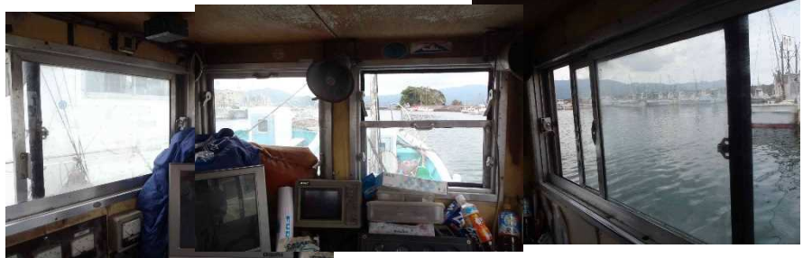
写真4 A船の操舵室からの見通し状況

船長Aは、内浦湾で時々プレジャーボートが釣りをしていることを知っており、前方を見渡し、プレジャーボートが見当たらなかったのち、ほかに航行の支障となる船はいないと思い、05時53分ごろ漂泊をやめて北北西進を始めた。(写真4参照)