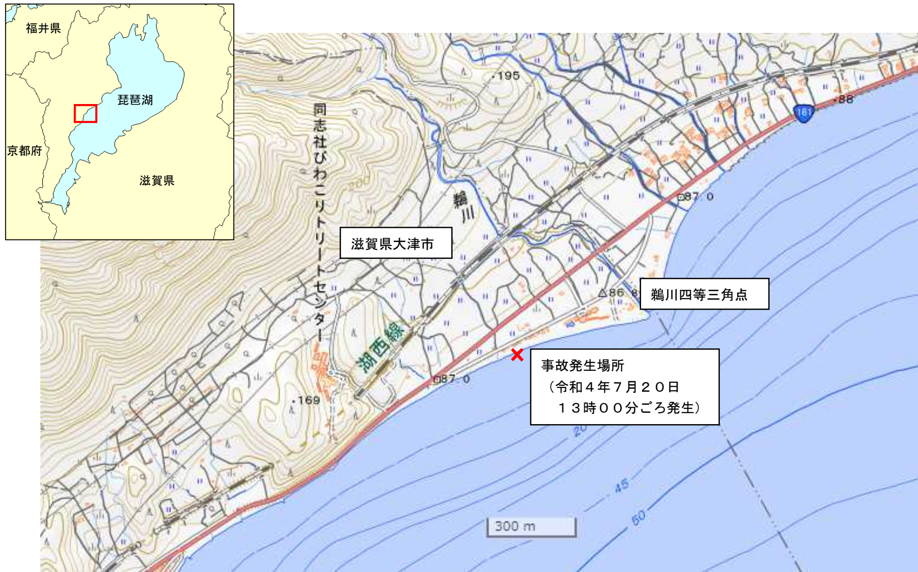
付図1 事故発生場所概略図