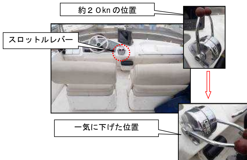
写真3 スロットルレバーの状況

同乗者B及び同乗者Cは、船首方に飛ばされ、揚錨機及び右舷側ハンドレールに、また、同乗者D及び同乗者Eは、ハンドレール等に、それぞれ身体をぶつけて負傷した。(写真3参照)