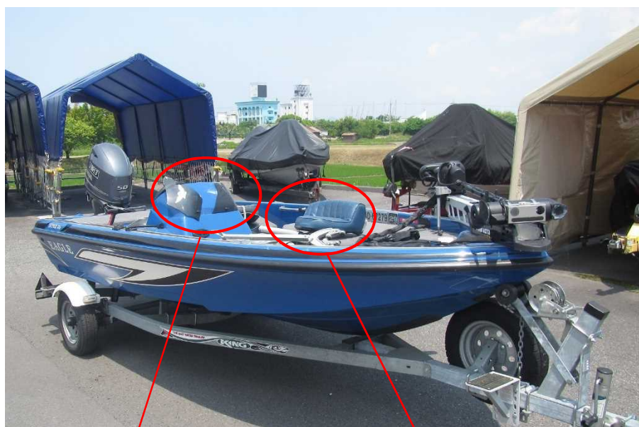
写真3 B船の損傷状況