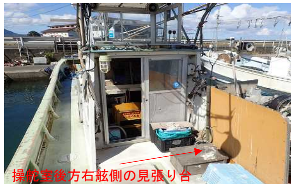
写真1 操舵室後方の状況