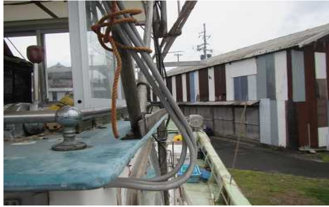
写真3 船長の操船位置における船首方の死角の発生状況