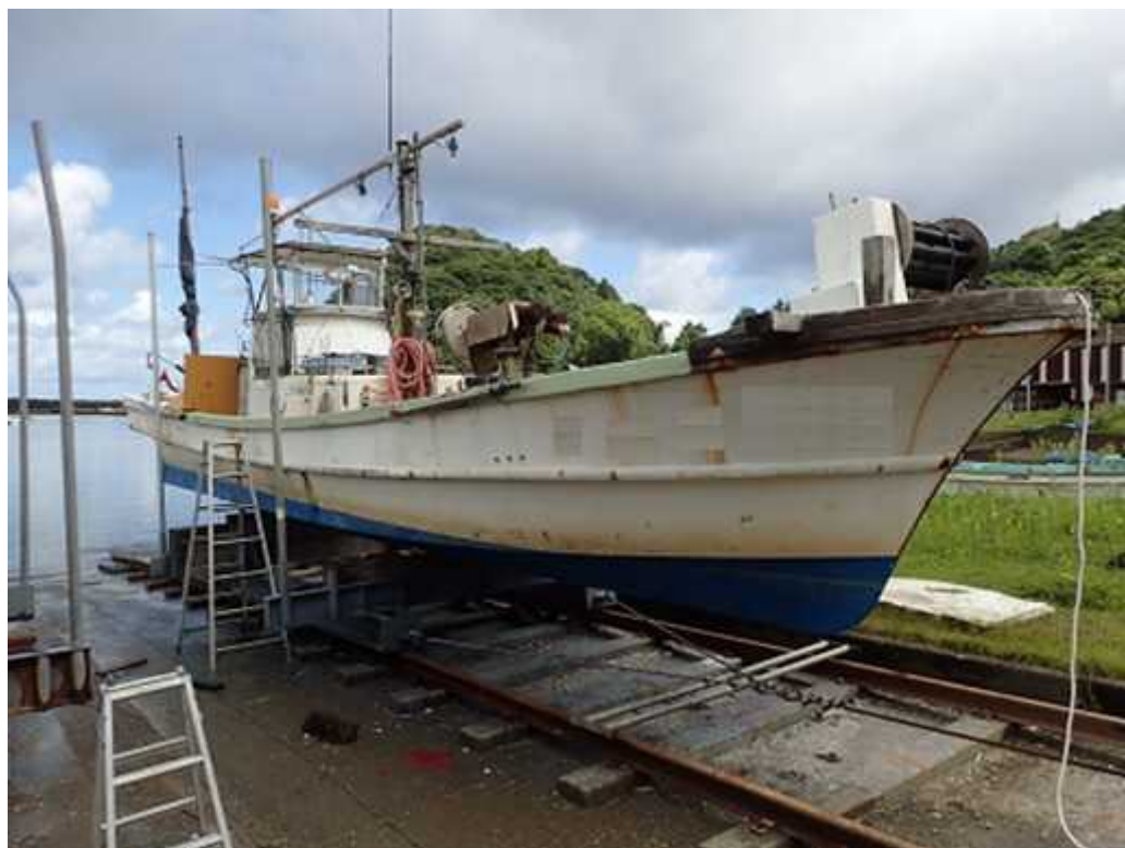
付表1 インストラクタ及び本件参加者の服装