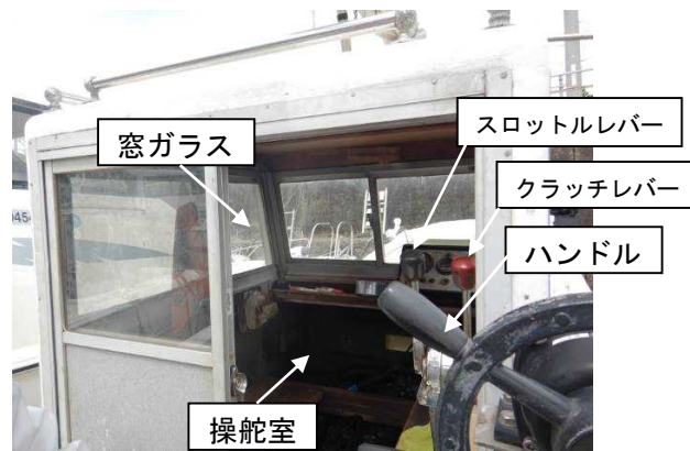
図3 船長Aが座った状態で前方を見た状況

船長Aは、釣りを始めてから釣りに集中し、B船がA船の左舷船首方近くで漂泊していることに気付いておらず、A船が本件干出岩付近に接近していたことに気付いた際、本件干出岩を避けようとして右舷側に気を取られ、座った状態で慌ててハンドルを左に取り、前方を見ながら前進したので、B船がいる左舷船首方をよく見ていなかったと本事故後に思った。(図3参照)