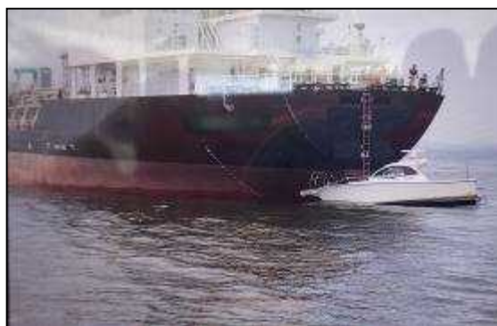
写真3 衝突後の状況

船長Bは、前路に航行の支障となる船舶はいないと思い、航行を続けていたところ、眠気を感じて、いつしか居眠りに陥り、後部甲板に座っていた釣り客から、危ないとの声を聞いて目が覚め、衝突の直前に左舵一杯としたものの、11時50分ごろB船の船首部がA船の右舷船尾部に衝突した。（写真3参照）