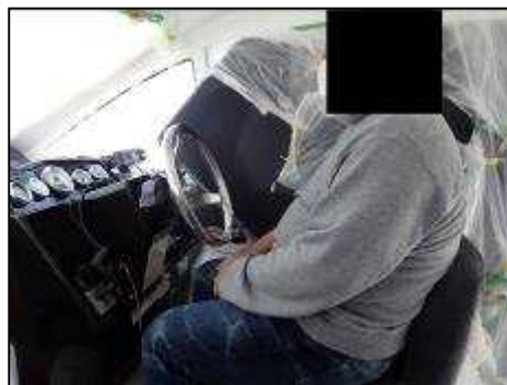
写真2 船長Bの操縦状況（イメージ）

船長Bは、11時40分ごろ、前路に船舶の往来がないのを目視で確認し、操舵室内の操縦席に腰を掛けた状態で自動操舵とし、操舵室内に釣り客1人、後部甲板上に釣り客B 1 、釣り客B 2 及び別の釣り客1人が座り、続航した。（図1参照）