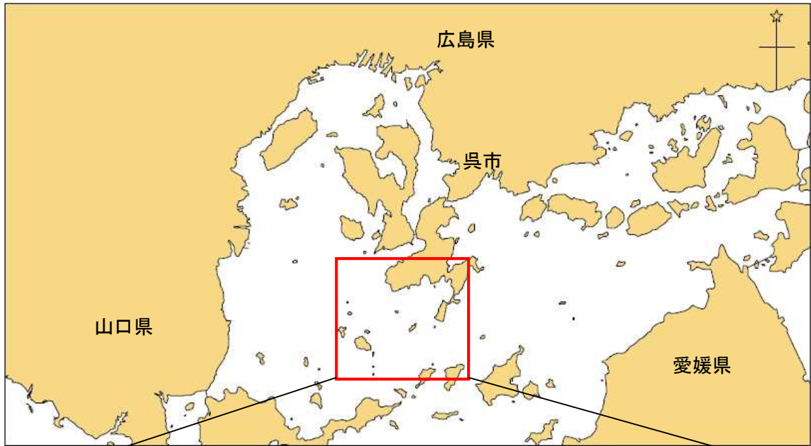
付図1 事故発生場所概略図