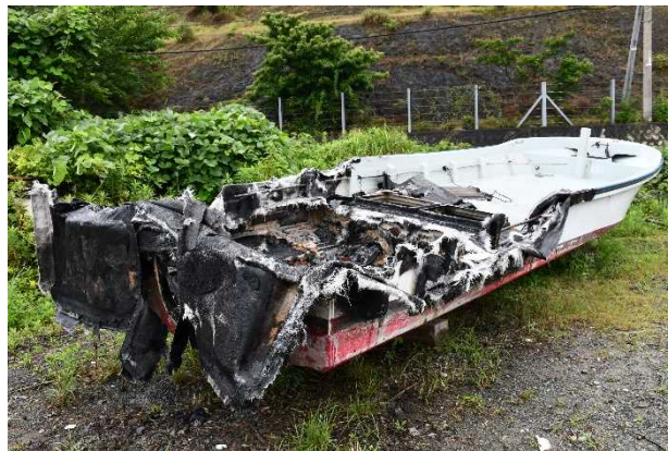
写真2 引き上げられた本船