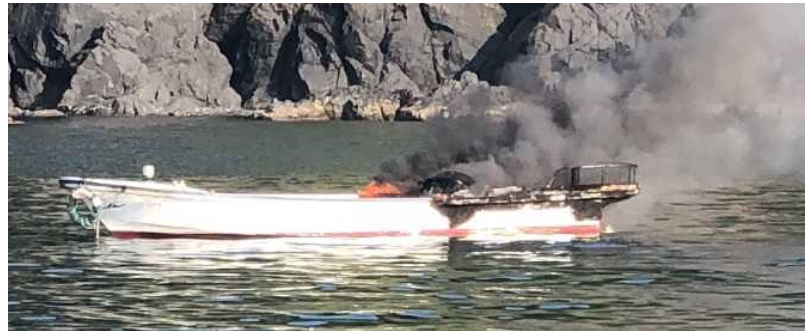
写真1 炎上中の本船

本船は、巡視艇により沖合へえい航中に20時35分ごろ沈没し、後日引き上げられた。(写真1、写真2参照)