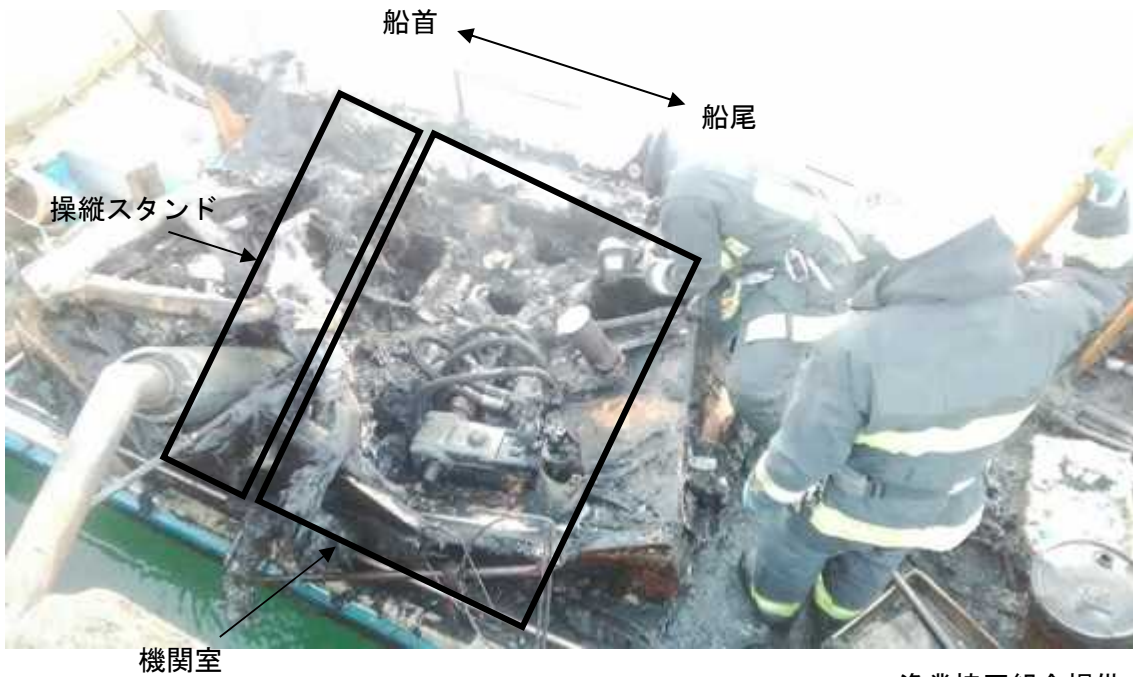
写真2 操縦スタンド付近の焼損状況