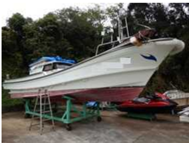
写真2 B船（船首側より）