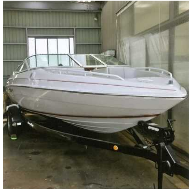
写真2 右舷船首部外観