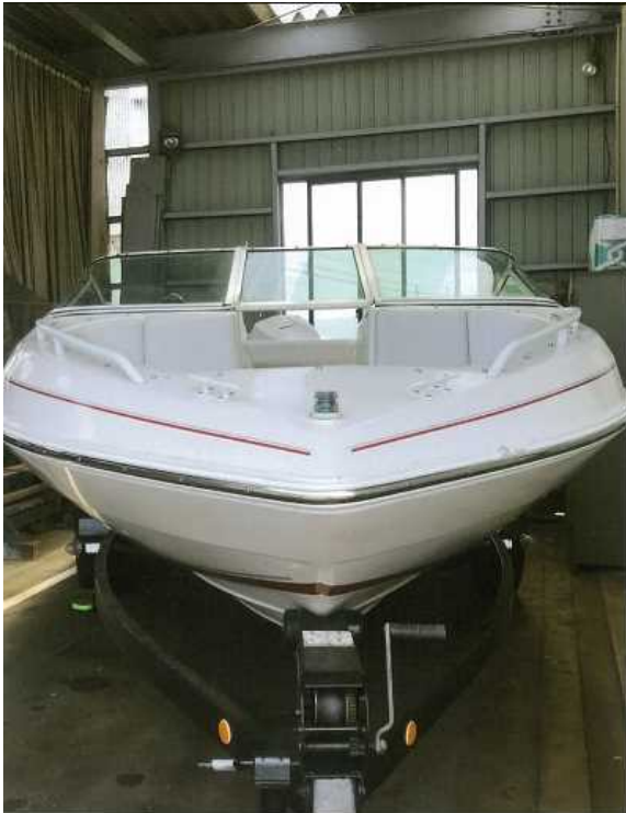
写真1 正船首部外観