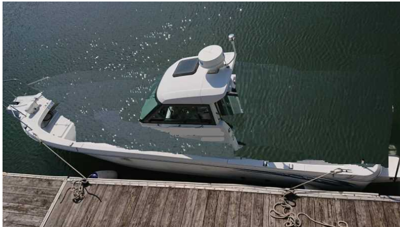
右舷後部側に傾き、操舵室の概ね下半分から下部が水没した状態