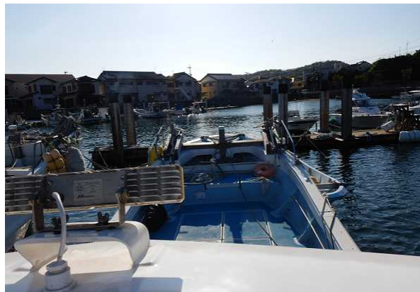
写真3 A船操舵室の天窓からの見通し状況

船長Aは、甲板上を作業灯で照らした錨泊中の大型船を右舷船首方に見る態勢で西南西進中、05時10分ごろ、突然、衝撃を感じ、機関を中立運転としたところ、A船の左舷側にB船が見え、A船がB船と衝突したことが分かった。