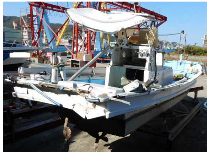
写真5 B船（右舷船尾方から撮影）

船長Bは、錨泊中の大型船を右舷船首方に見る態勢で西南西進中、たまたま右斜め後方を見たとき、間近にA船の白灯及び船体が見え、すぐに左舵を取ったが、A船がなおも接近するので、更に左舵を取ったものの、A船の船首部がB船の右舷船尾部に衝突してB船の右舷後部に乗り上がった後、A船が右舷側に離れて行くのを見た。