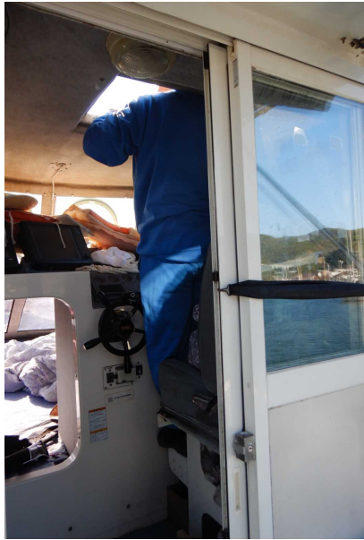
写真2 A船操舵室の天窓から顔を出している状況（再現）