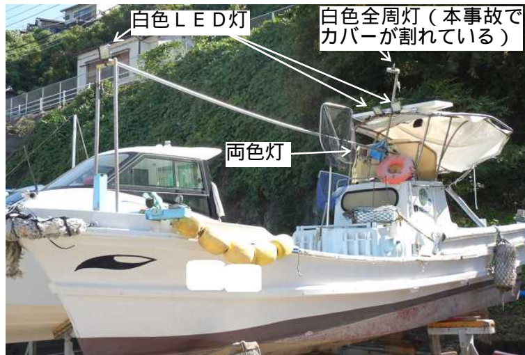
写真4 B船（左舷船首方から撮影）

06分ごろ四郎ヶ島南方沖で大中瀬戸に向けて長崎市伊王島大橋の灯火を左舷船首方に見るように左に変針してB船を西南西進させた。 (写真4、写真5 参照)