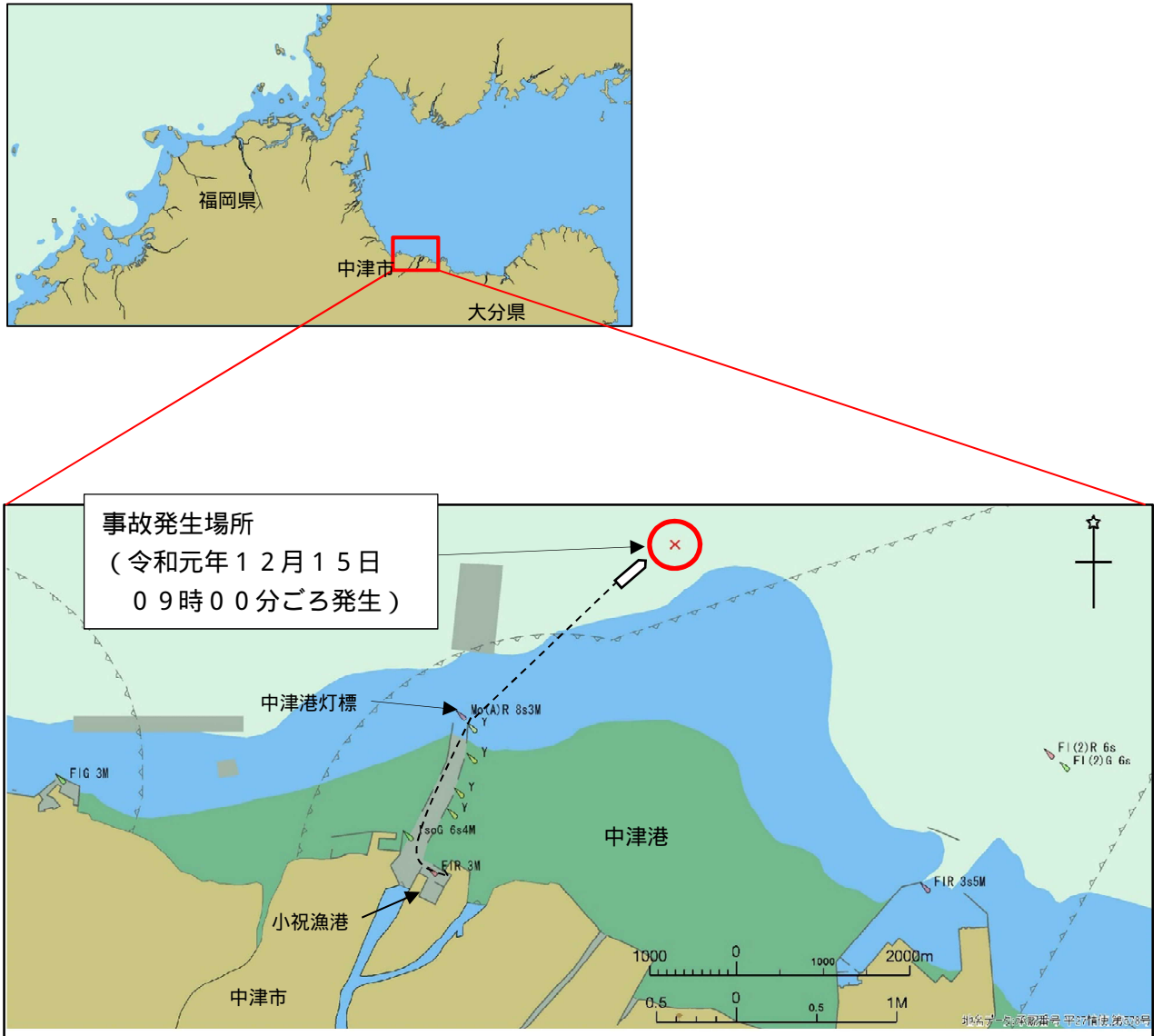
付図1 事故発生経過概略図