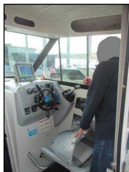
写真5 船長Bの操船姿勢