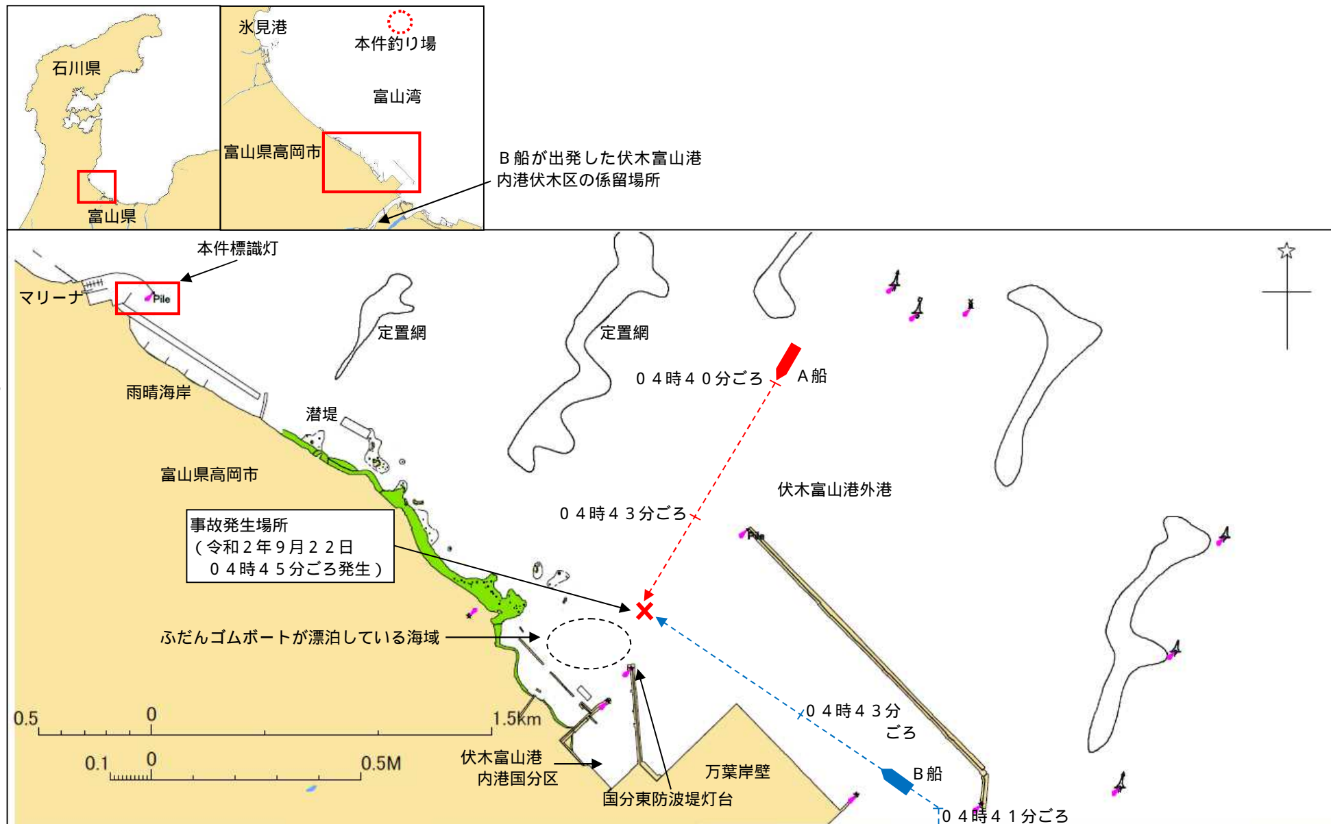
付図1 事故発生経過概略図