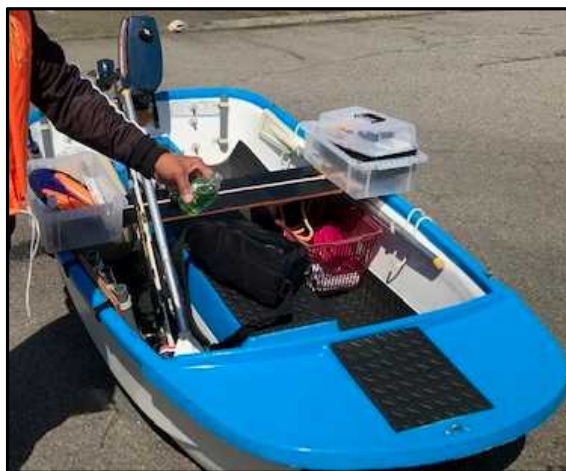
本件出港時の積載状況