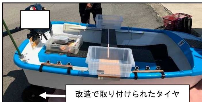
修理改造後（本件出港時）