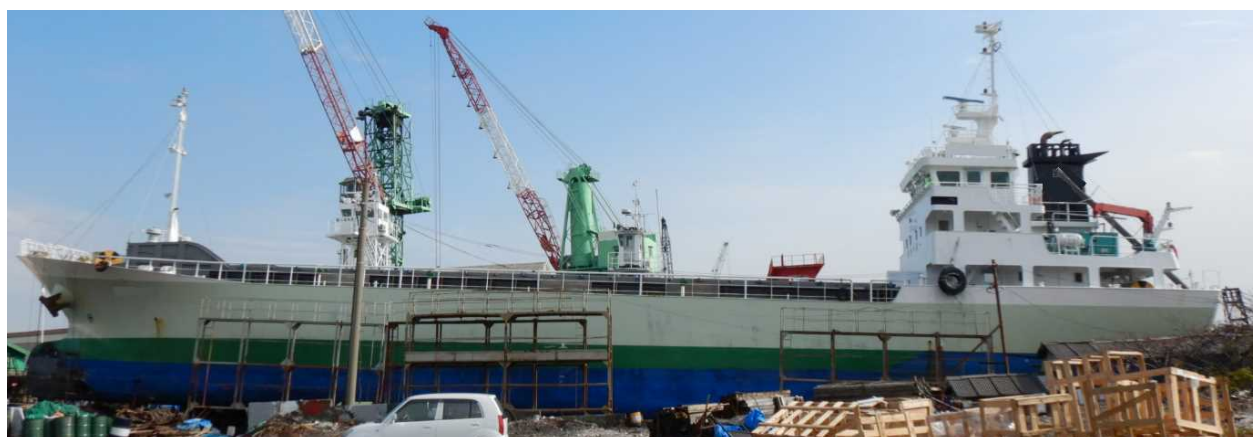
写真2 本船(上架した状態)

※船位は、船橋上方に設置されたGPSアンテナ位置である。また、対地針路は真方位である。 なお、船首方位については、簡易型AISのため記録されていなかった。