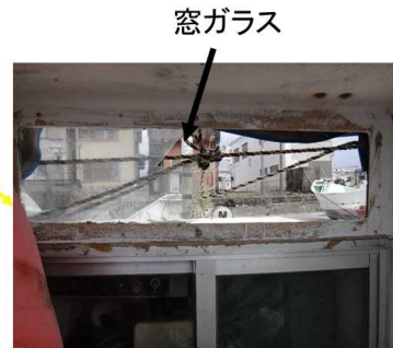
座った状態での前方の見通し状況