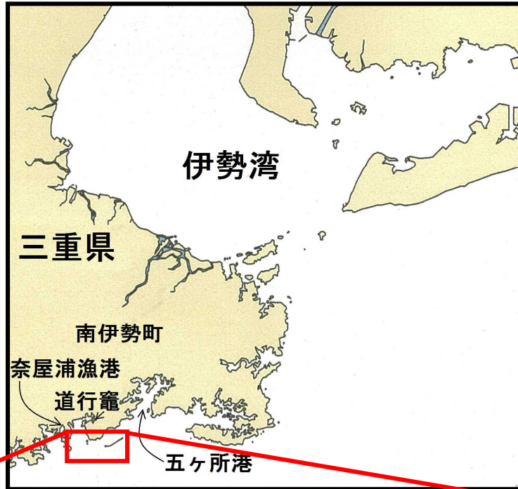
付図1 事故発生経過概略図