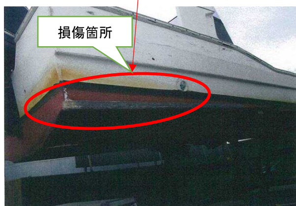
写真5 B船の損傷状況（右舷船尾側）