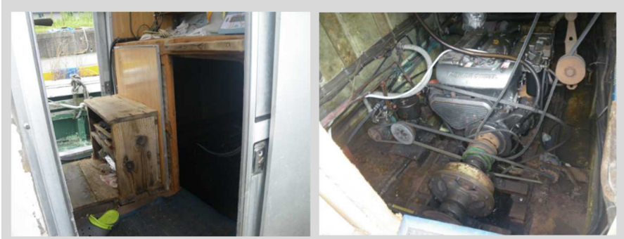
写真1 操舵室左舷側後部及び機関室の状況