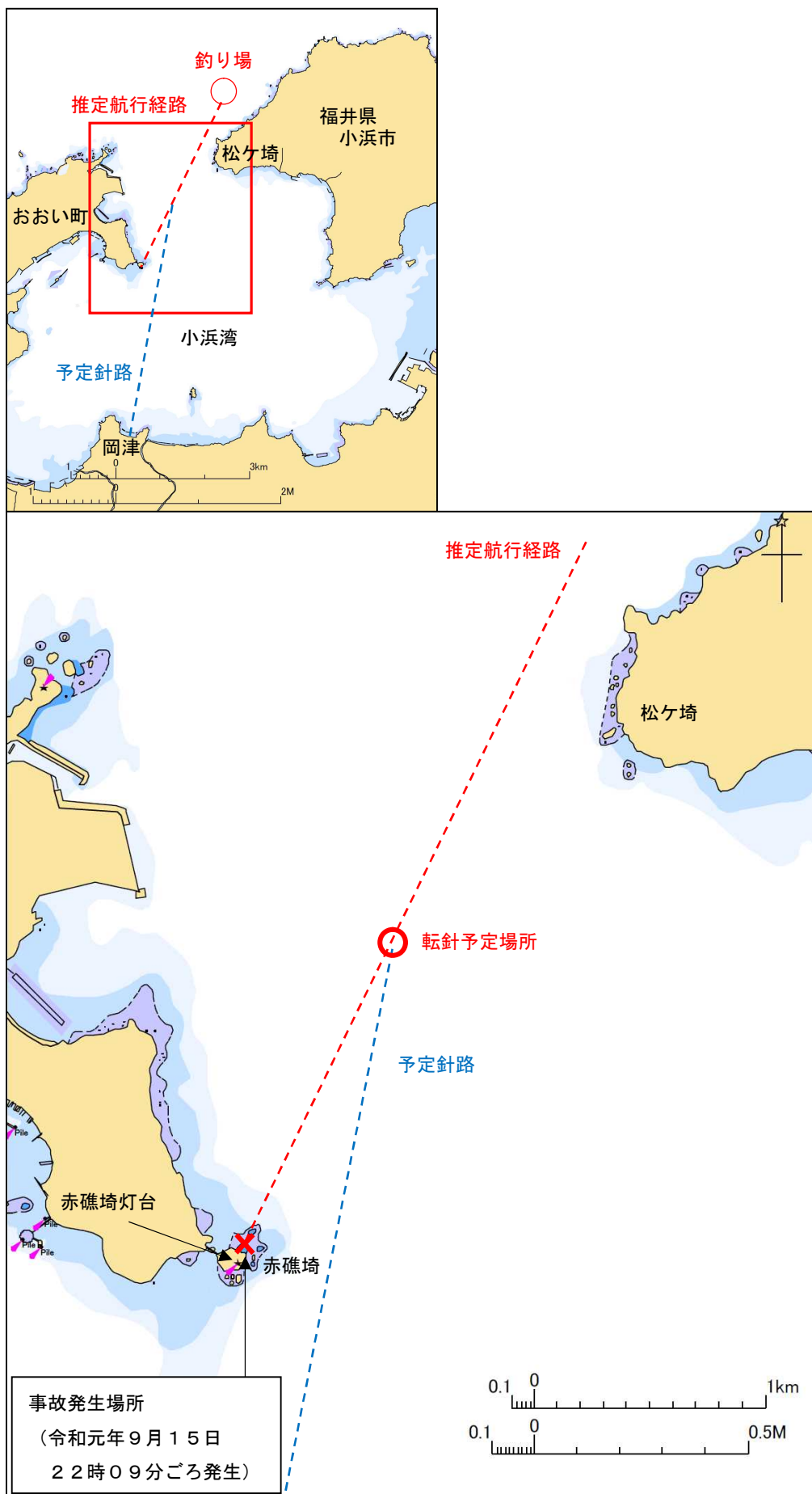
付図1 事故発生経過概略図