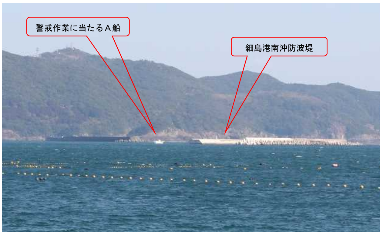
写真5 本事故発生場所付近の状況②