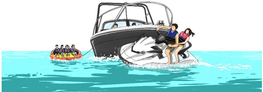
イメージ図2 A船とB船が衝突した状況

B船は、船長Bが、同乗者Bを楽しませようと思い、その場で増速しながら右回転中、右舷方至近にA船を認め、ハンドルを左に切ったが、A船と衝突した。(イメージ図2参照)