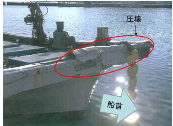
写真2 A船の損傷状況