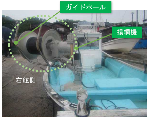
写真3 揚網機の設置状況（同型船）

本船が行うさざえ網の刺し網は、 おもり 錘で網を海底に沈めて（浮子は付いていない）海底付近のさざえ等を捕獲するもので、網の両端には海面上での目印として旗竿が取り付けられていた。（図2参照）