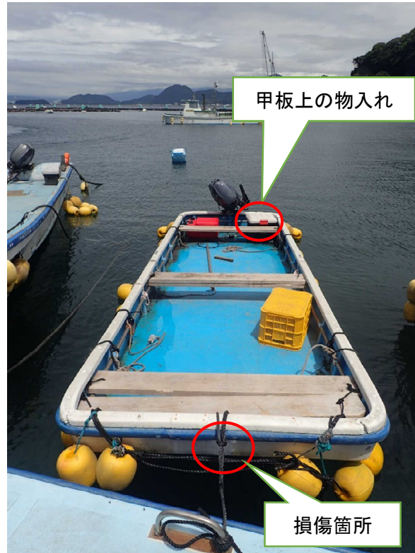
写真4 B船の損傷状況（船首部）