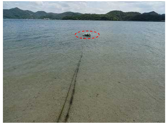
写真2 本件係留場所