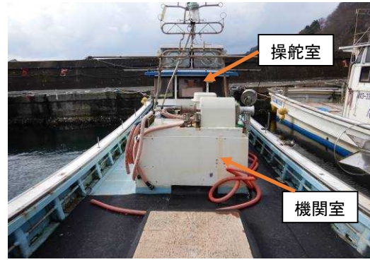
写真2 操舵室及び機関室