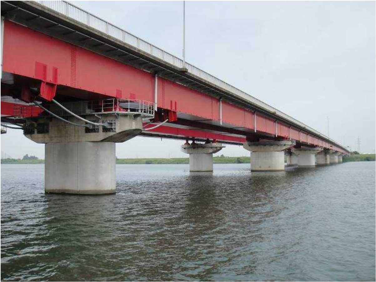
写真4 新幹線橋梁付近