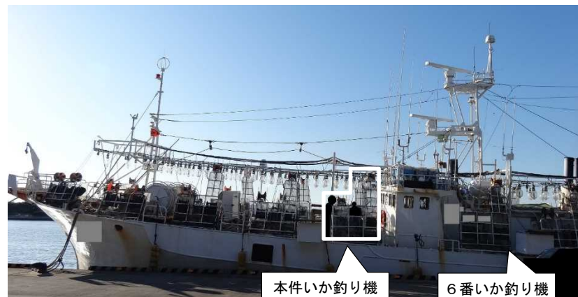
写真1 本船の状況（現場調査時）

船長は、02時25分ごろ小用のため、操舵室を出て左舷側の通路から船尾方に行くとき、舷外に出した本件いか釣り機の受け台（いかの落下防止用）の上で釣り針の絡みを解いている甲板員Aを、また、甲板上で船尾方を向いて6番いか釣り機の釣り針の絡みを解いている機関長をそれぞれ見掛けた。（写真1、写真2参照）