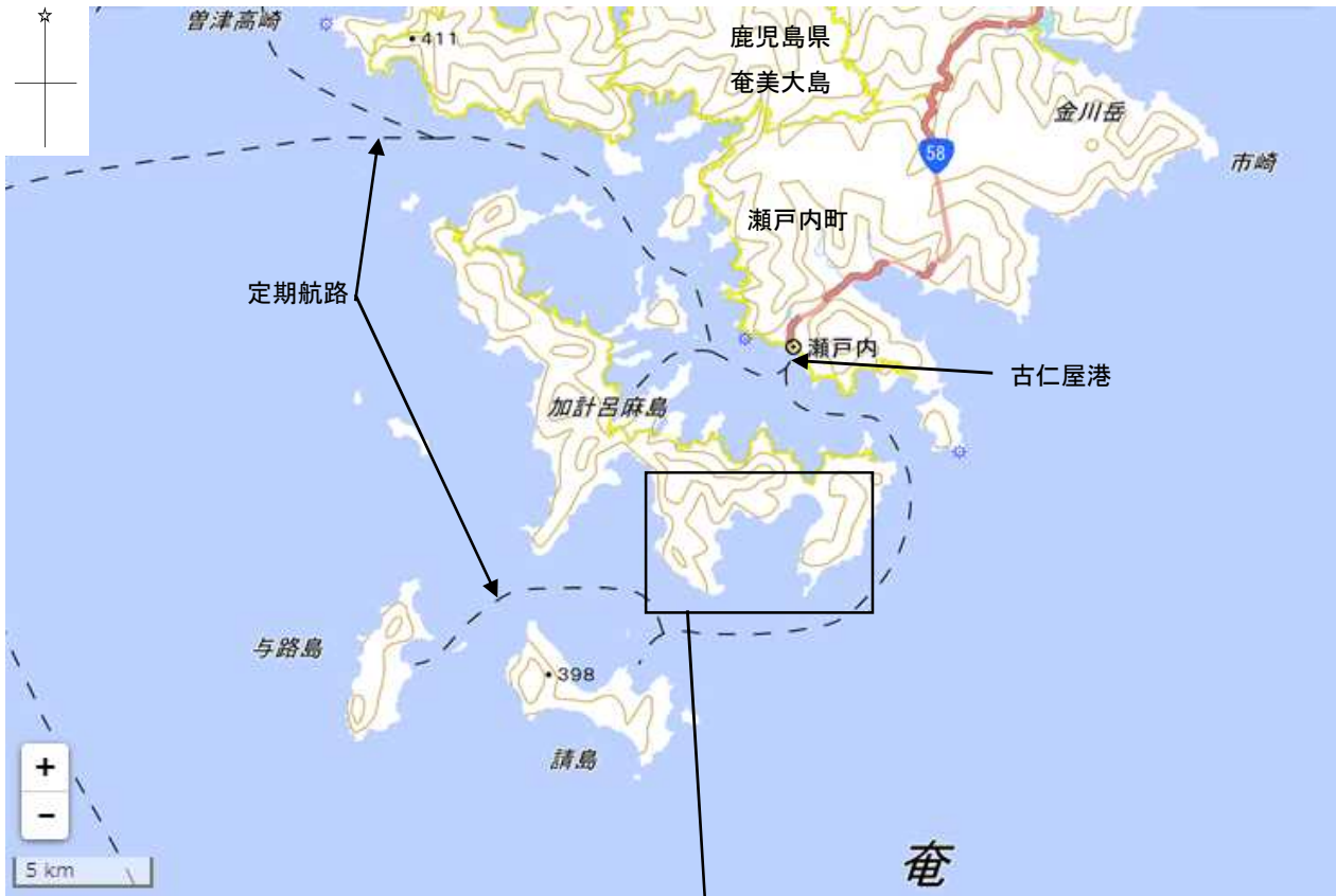
付図1 事故発生経過概略図