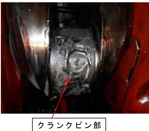
写真4 クランクピン部焼付状況