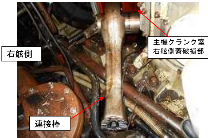
写真2 接続棒破損状況