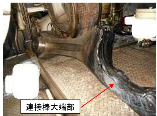
写真3 接続棒大端部焼損状況