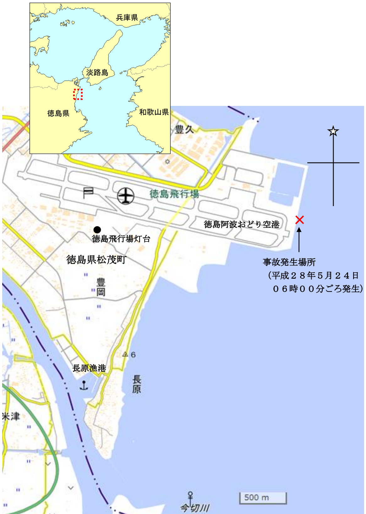
付図1 事故発生場所概略図