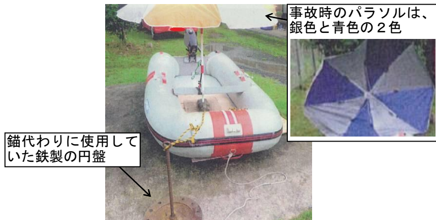
写真2 B船の状況（再現）

B船は、06時10分ごろから本件養殖筏の北方20～30m付近で錨泊していたが、潮流が北流から南流に変わり、本件養殖筏に向けて圧流されるようになったので、08時ごろから本件養殖筏の北東方15～20m付近に移動して錨泊していた。