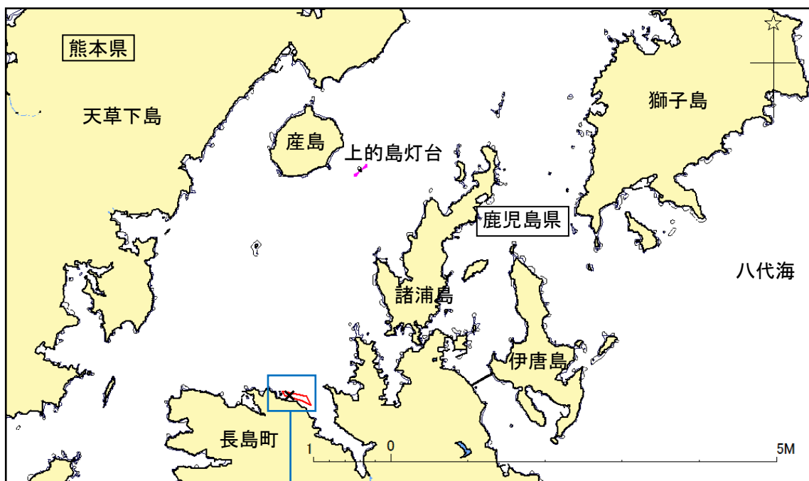
付図1 事故発生経過概略図