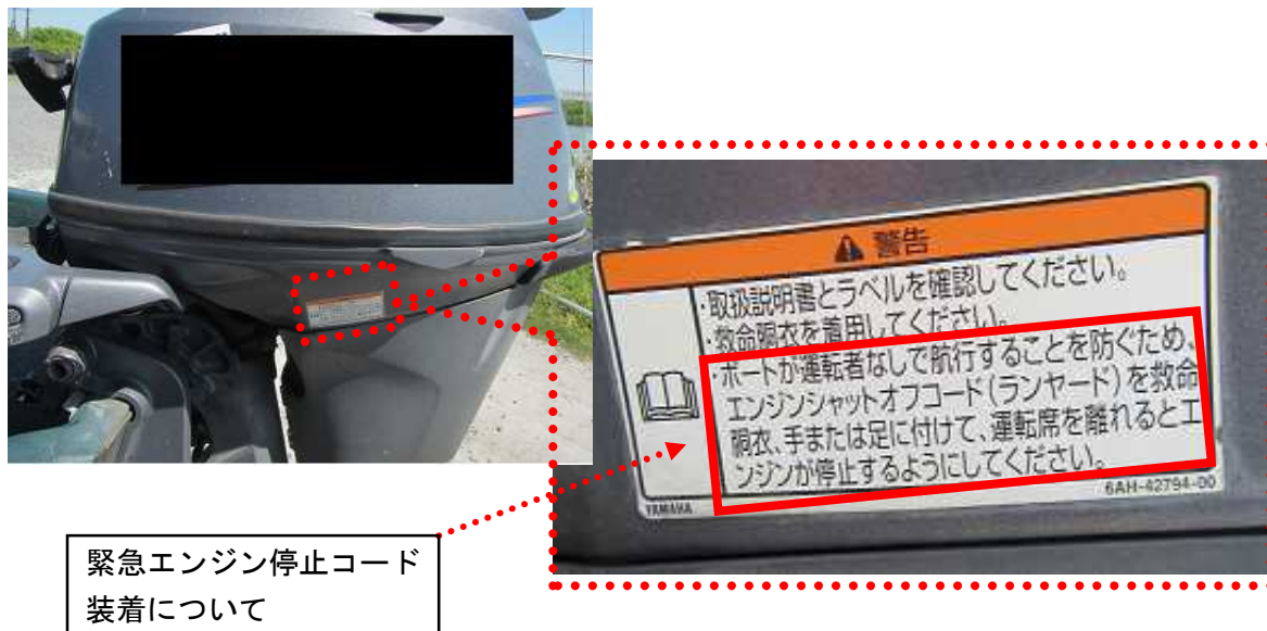
写真4 船外機使用上の注意