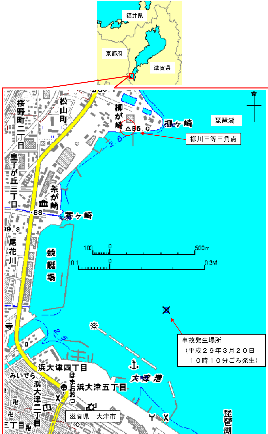
付図1 事故発生場所概略図