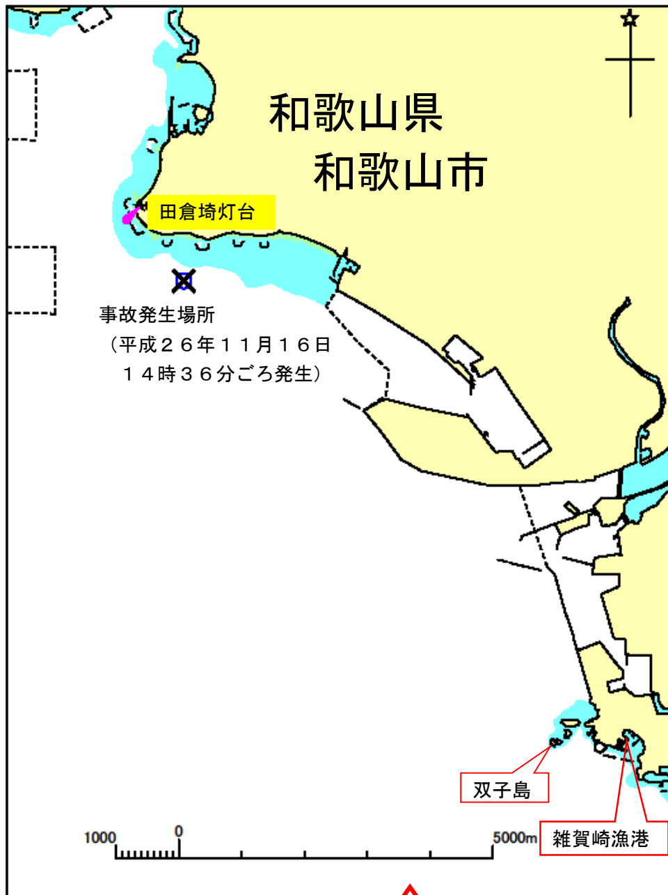
付図1 事故発生場所概略図