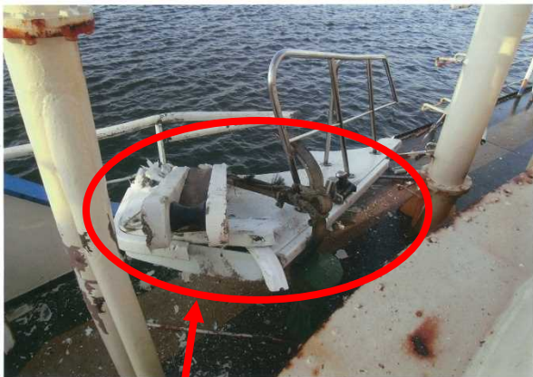
分断されたB船船首部