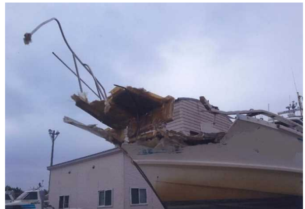
写真2 B船船首部損傷状況