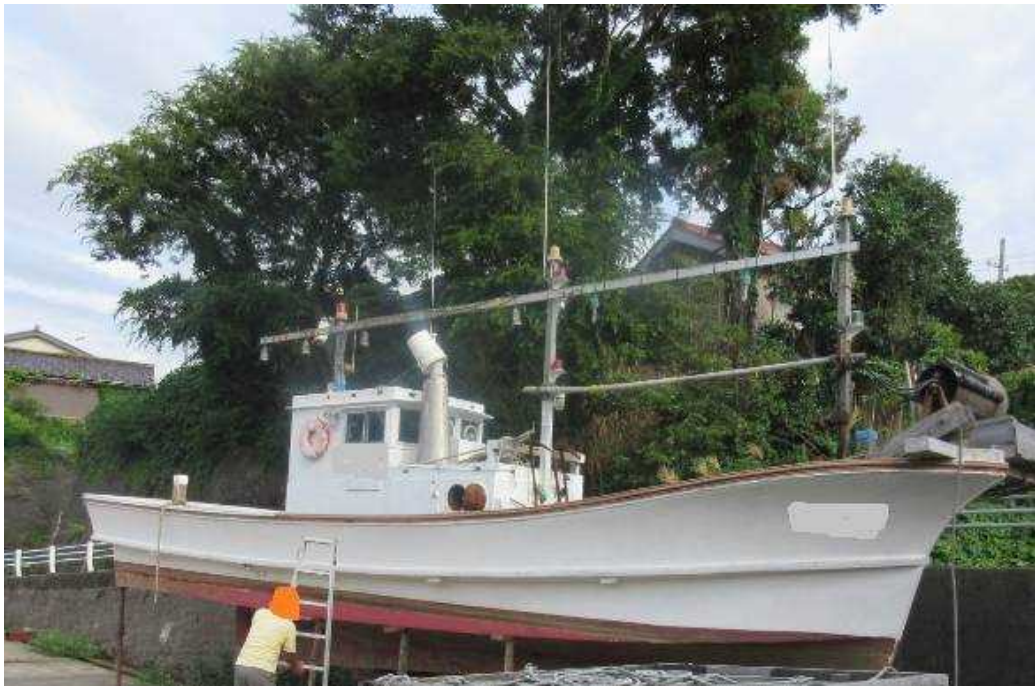
写真2 B船（衝突直前の船長Bの状況）