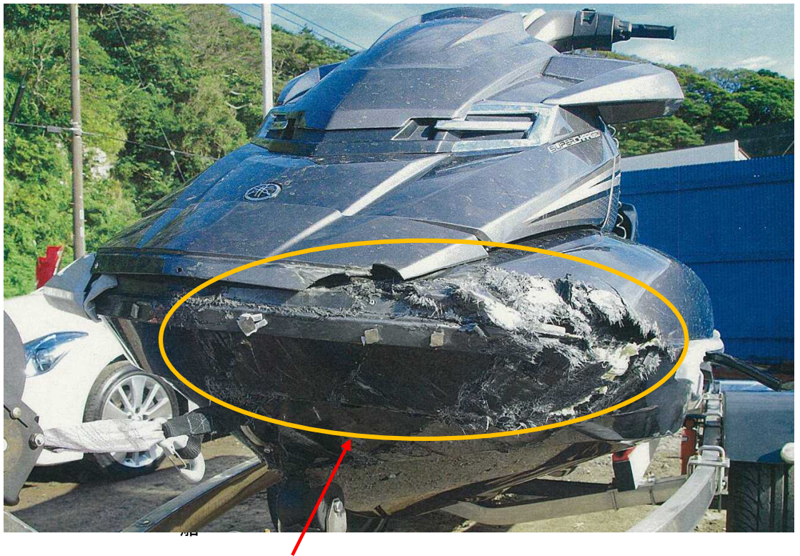
左舷船首部の破損