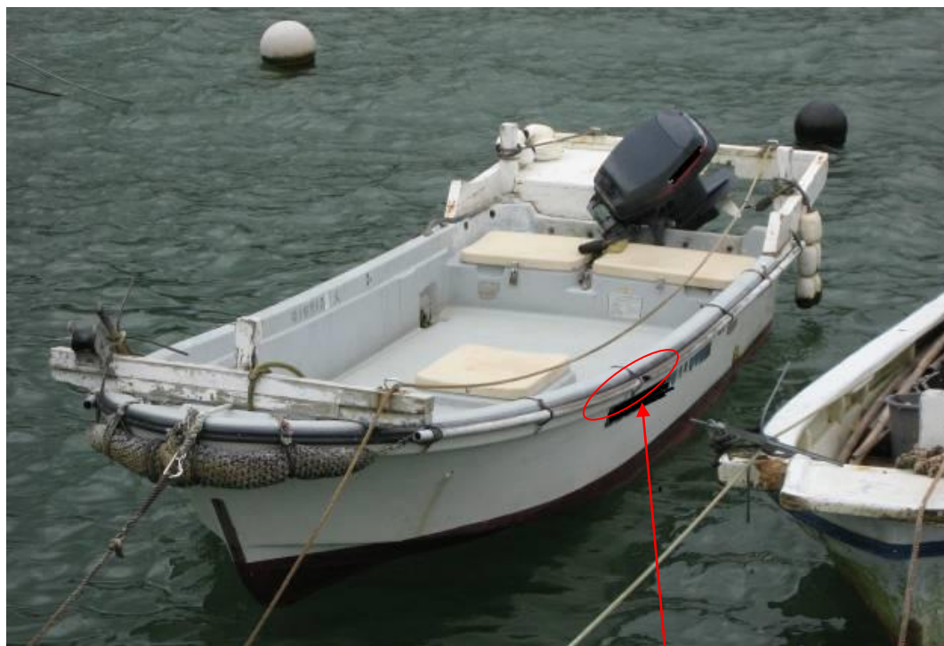
A船と衝突した箇所