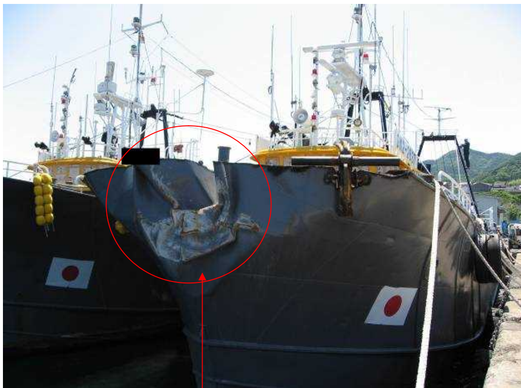
損傷箇所（上部のブルワーク部を切り取った状態）